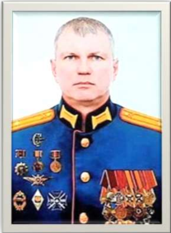
Награждён орденом Мужества, медалями.